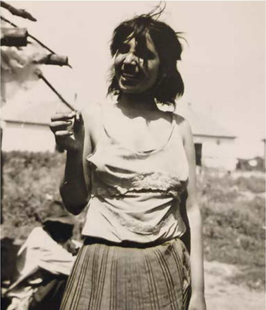
15. ábra. Nő cigarettával Forrás: Császár Csaba, Ópályi, 1970.

Végül, de nem utolsó sorban az Öregember pipával című képen egy, a szegregátumban élő idős férfit láthatunk. Jellemzően pipával a kezében, és kalapban ül, amely kép megfelel a cigányokról alkotott általános szimbólumrendszernek. Míg a felsőbb osztálybeli idős férfi öltö-zéke elegánsabb volt, addig az utolsó képen egy jóval szegényesebb külső tárul elénk. A helyiek emlékezete szerint a férfi vályogvetőként dolgozott.