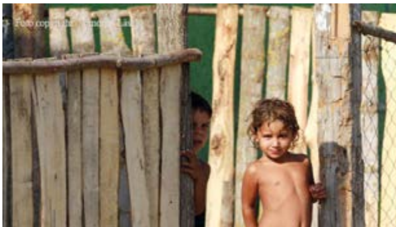
9. ábra. Bujkáló gyerekek