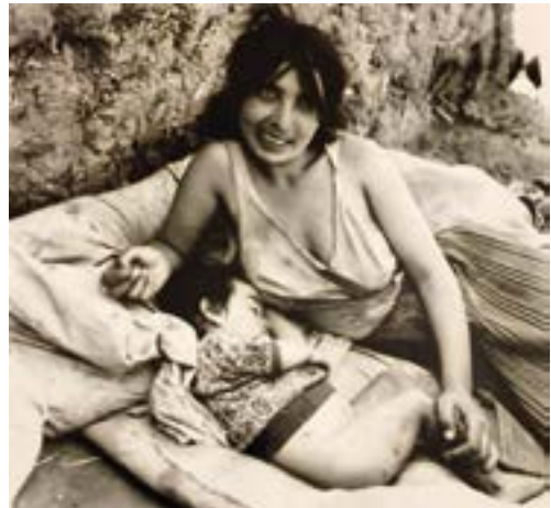
13. ábra. Délutáni pihenés Forrás: Császár Csaba, Ópályi, 1970.