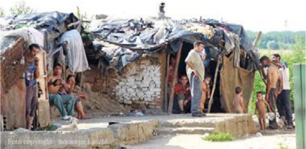
11. ábra. A lakhatási viszonyok változatlansága