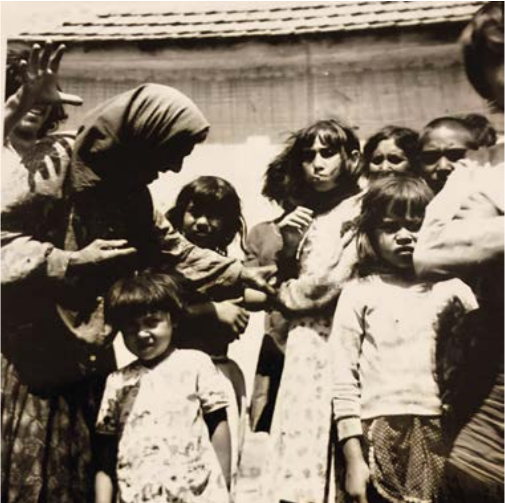
6. ábra. A ház előtt Forrás: Császár Csaba, Ópályi, 1970.

háziállatnak tűnik a képen, míg napjainkban a közösségben inkább beszélhetünk kőborkutyákról.