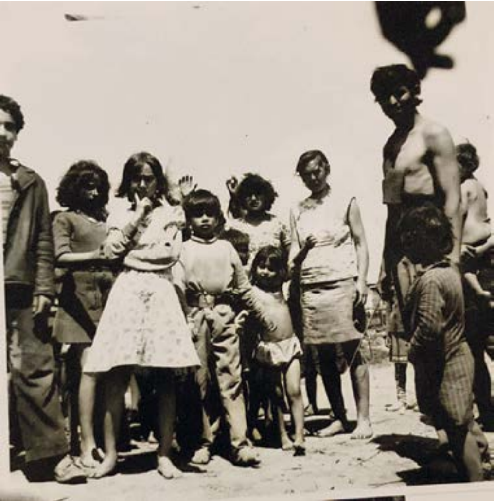
3. ábra. Csoportkép cigarettával. Forrás: Császár Csaba, Ópályi, 1970.

A csoportképek távolabbi perspektívából világítanak rá a képen szereplők mindennapjaiba. Ruházatuk, környezetük és egymáshoz való viszonyuk proxemikája jelenik meg az alább bemutatott képeken. A harmadik ábrán több, mint tíz ember látható, akik közül többen takarásban vannak. A sorozat első képe ikonikus jeggyel van ellátva, amely egy árnyék formájában mutatja meg a cigarettát tartó kezet a jobb felső sarokban. Mint ahogyan azt a empiria bevezetőjében ismertetem, a fényképeket felvevők cigarettával rukkoltak elő a fényképek alanyainak motiválása érdekében. A cigarettával emellett szimbolikus jelentéssel is bír. A mélyszegénységben élők életében