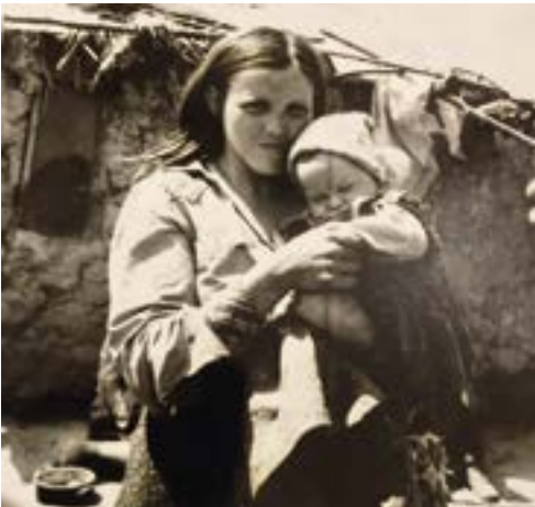
12. ábra. Anya és gyermeke Forrás: Császár Csaba, Ópályi, 1970.

Ebben a tanulmányban három “duó” feldolgozására vállalkozom, melyek az 1970-es években készültek. A három kép közül kettő központi témája az anyai szeretet (és az anya-gyermek kötődés), s végül a harmadik fotográfia kissé kilóg a sorból. Az Idős házaspár című képen vélhetően nem a szegregátumban lakó emberek láthatók. A kép beállítását is árulkodik egy más társadalmi csoportba való tartozásról: az újság olvasása, a kerítés előtti padon való ücsörgés, valamint mindkét személy öltözéke (kalap, szemüveg). Az idős házaspárhoz képest a két anya fiatal, és csecsemőikkel jelennek meg. A gyerek, mint az egyik legfontosabb érték ebben az esetben is adott az ábrázolt családokról készült képeken.