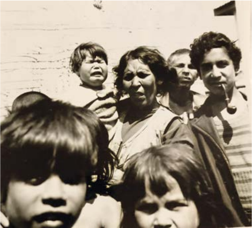
4. ábra. Csoportkép pipával Forrás: Császár Csaba, Ópályi, 1970.

A férfiak számára a pipa státuszszimbólumot is jelent, amelyet a negyedik ábrán láthatunk egy fiatal férfinél. A képről kíváncsi tekintetek néznek vissza ránk – azaz a fótásra. A közelebbi és távolabbi alakok megjelenése a kompozícióban jól mutatja mind a tolakodó érdeklődés hangulatát (a két gyerek alakja elől), mind azt a fajta bizalmatlan távolságtartást is, amelyet az idegenek felé közvetítenek valahányszor ismeretlen személy látogat el a közösségbe (a felnőttek