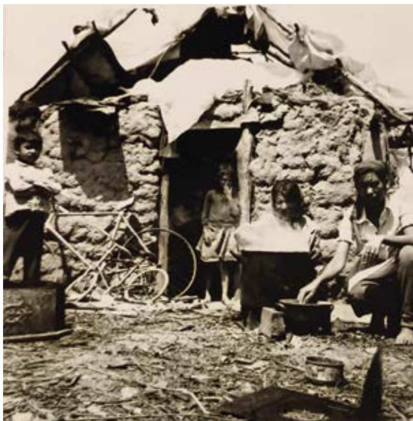
10. ábra. A ház és a lakói