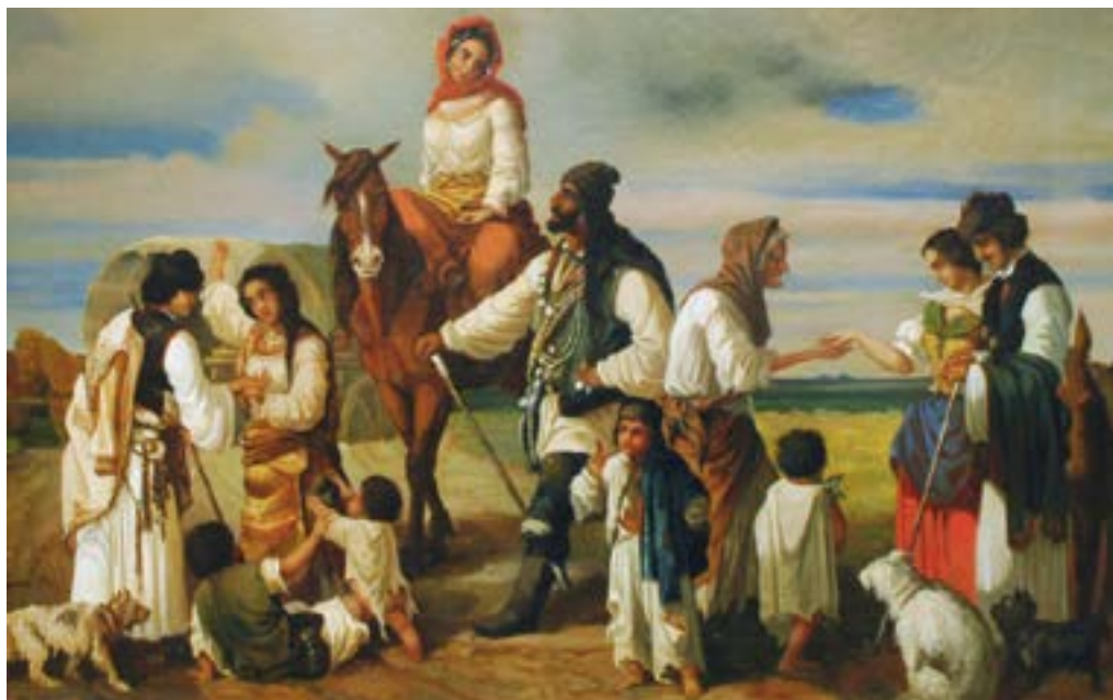
1. ábra. Cigányélet.

Forrás: Jankó János, 1854. (olaj, vászon, 42x42 cm), Déri Múzeum.