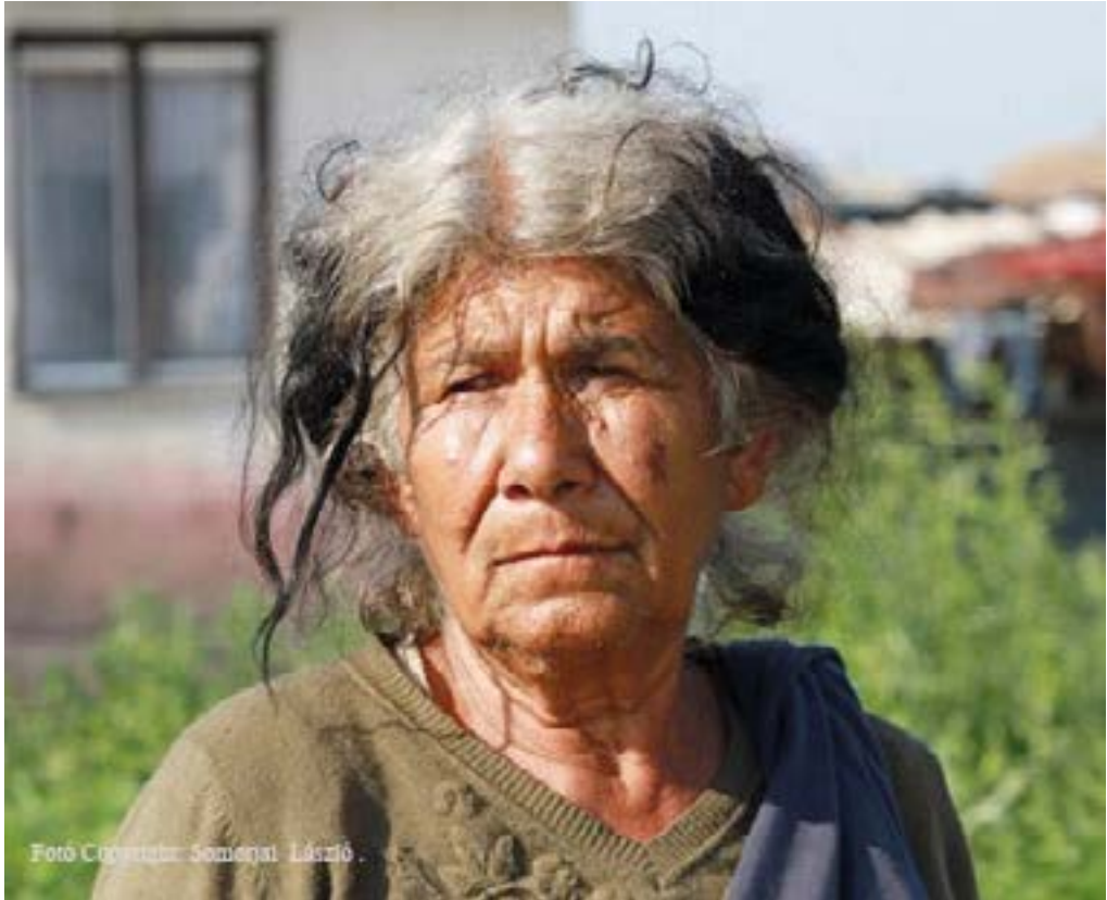
5. ábra. Portré egy anyáról

A 2012-es fotósorozatban egy portré szolgál értékes információval az idő múlásáról. A Csoportkép pipával című képen a központi alakot egy nő adta annak idején, akinek a portréja 2012-ben is elkészült. A helyszín változatlansága nem véletlen. A fotó alanyáról későbbi terepkutatók alkalmával kiderült, hogy soha nem is hagyta el lakhelyét költözés céljából.