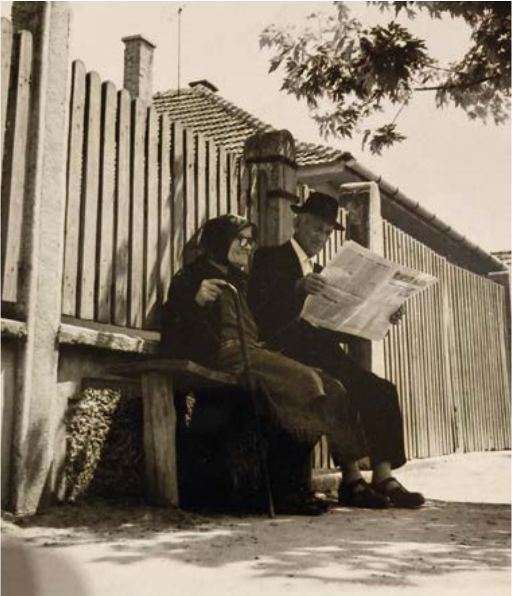
14. ábra. Idős házaspár Forrás: Császár Csaba, Ópályi, 1970.