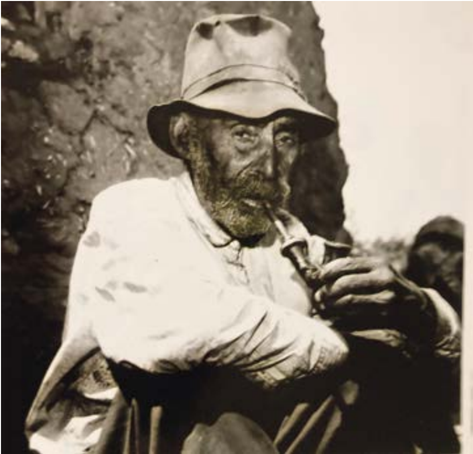
16. ábra. Öregember pipával