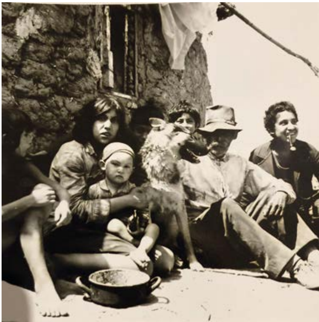
7. ábra. A földön ülve Forrás: Császár Csaba, Ópályi, 1970.

A 2012-ben készült fotósorozat ugyancsak ábrázol hiányos öltözetű gyerekeket. A rejtőzködés a Bujkáló gyerekek című fotón jobban észrevehető, mint az előző korabeli képen. Míg a később készült fotón a beállítás/mesterségesség közel sem látszik meglehetősen drasztikusnak, addig a nyolcadik ábrán csupán csak a legkisebb gyermek részleges takarása árulkodó jeleként szolgál.