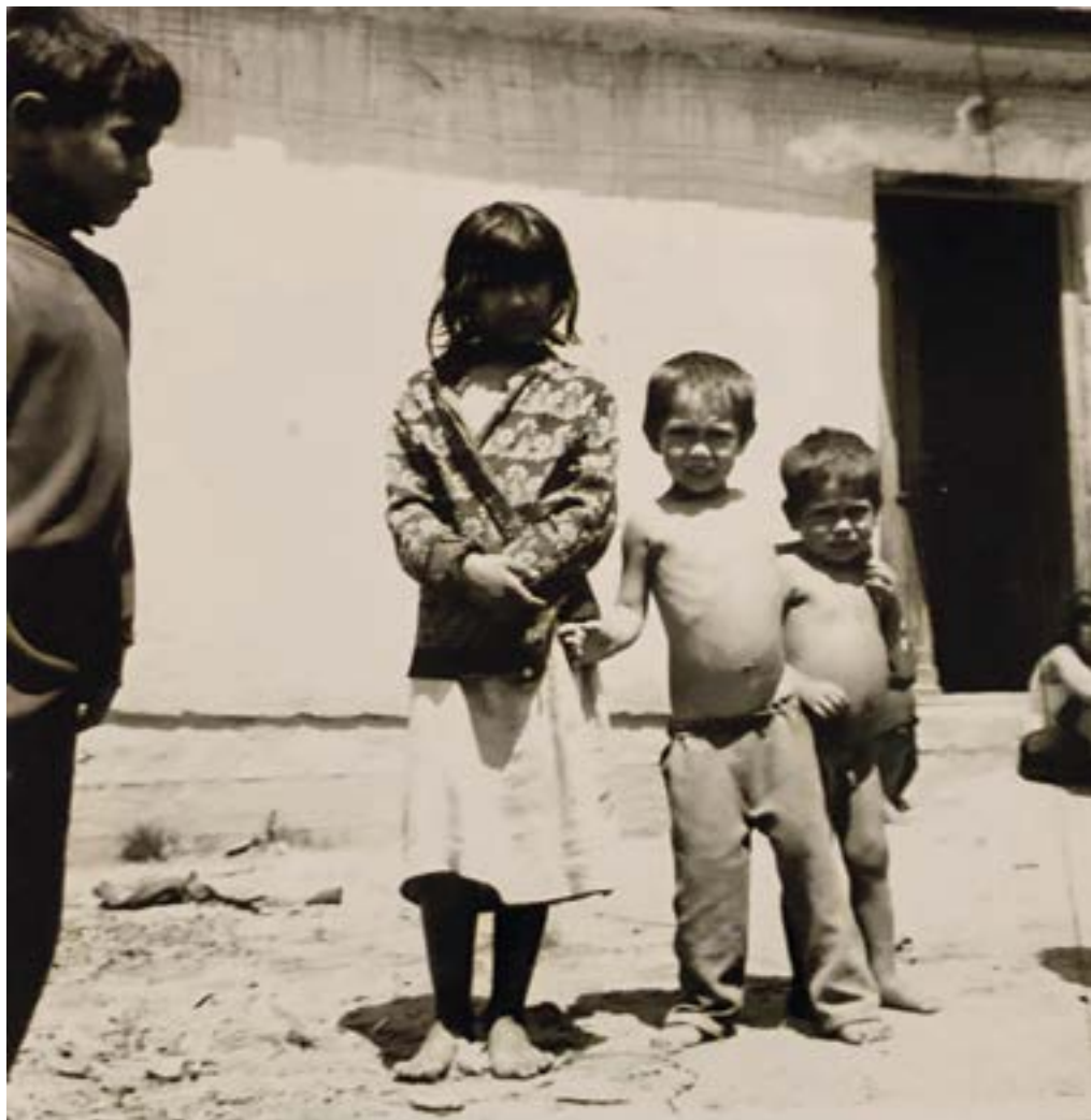
8. ábra. Kerek hasak, hunyorú szemek Forrás: Császár Csaba, Ópályi, 1970.