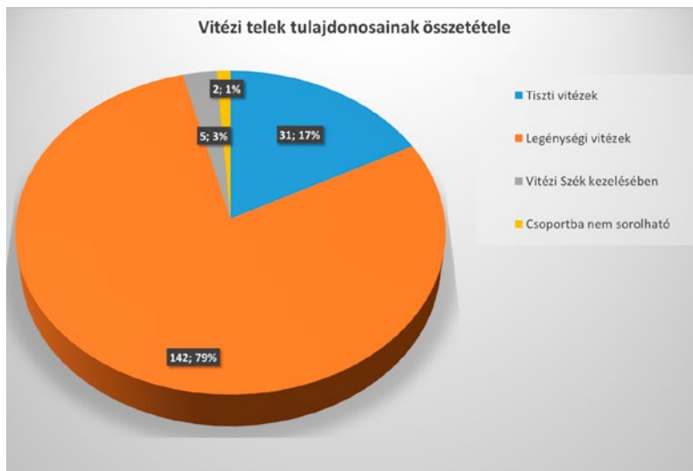
(1. ábra) A vitézi telkek tulajdonosainak összetétele. Az ábra a szerző saját munkája.

Amennyiben a magánszemélyek összetételét vesszük alaposabban szemügyre, akkor azt láthatjuk, hogy a magyar társadalomban szinte minden rétege megfigyelhető. Természetesen a legkiemelkedőbb számban a módosabb személyek alkotják a volt tulajok többségét, hiszen nekik volt lehetőségük földeket átruházni. Közülük is kiemelkednek a nemesek (főleg a főnemesek). 27 Ez a magasnak mondható jelenlét esetében két lehetőség vetődik fel, mint lehetséges magyarázat. A vármegyei nemesség nagyfokúan támogatta a Vitézi Rendet, mert meggyőződésük volt, hogy szükséges a szervezet az esetleges újabb baloldali fordulat elkerülése végett. Esetleg saját pozíciójuk megerősítése végett a hatalom (Horthy) irányába tettek gesztust a Vitézi Rend támogatásával. Perdöntő bizonyíték híján mind a kettő megközelítés megállja a helyét és feltételezhető, hogy mind a kettőre van példa (még ha nem is nevesíthető).