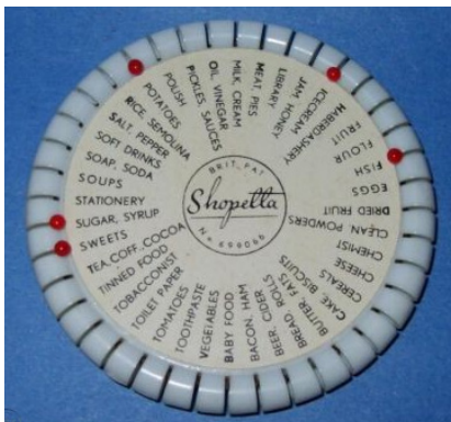
Shoppetta, brit szabadelom