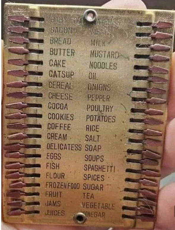
Retro fém bevásárlólista, 1940-es évek

Mechanikus vásárlólisták a 20. század közepéről