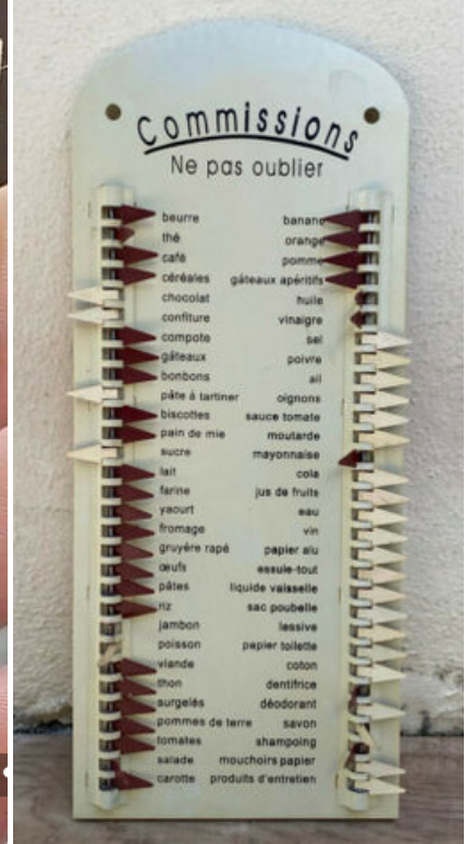
Francia plasztik bevásárlólista 1940-es évek.