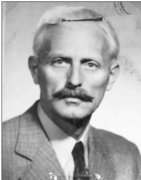
FOTÓ 6 „ A szabadulás 1. napján. 1956.10.09. Szem.ig.kép. ”