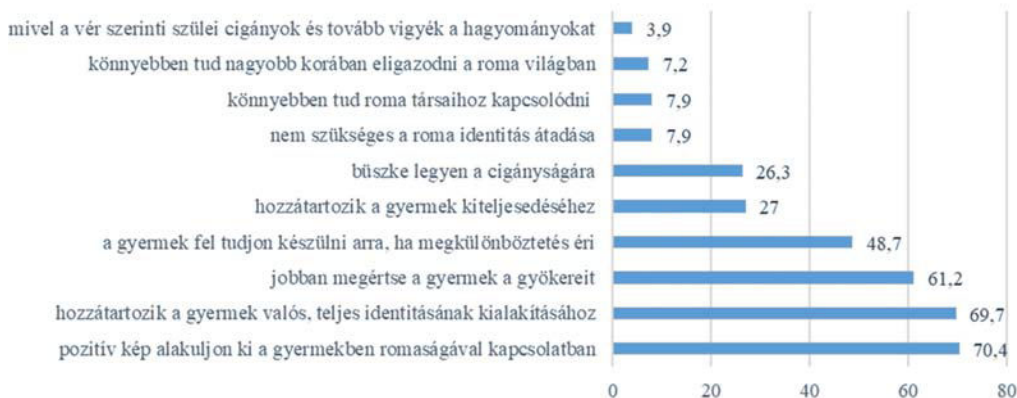
2. ÁBRA On szerint miért (lehet) szükséges roma/cigány identitás átadása örökbefogadott roma/cigány gyermekének? (%)

Bár az előzetes desk research kutatásaink során a társadalmi előítéletesség merült fel elsődleges motivációnak a roma identitás átadásakor, az eredmények alapján úgy tűnik, hogy a szülők sokkal inkább a gyermekük mentális egészségét helyezik előtérbe. Esetükben inkább úgy hangzik a diszkriminációra történő hivatkozás, mint egy megtanult, szükséges, vitathatatlan és így jó hivatkozási alap. A származás miatt érzett büszkeség is főként a diszkriminációval szembeni vagy másság-kezelési stratégiaként merülhet fel, de ez sokdrangú motivációként jelenik meg. A szülők véleménye alapján úgy tűnik, hogy a pozitív romakép kialakítása a legfontosabb, ahol implicit megjelenik a társadalom negatív romaképének ellensúlyozása és erre törekszenek a roma identitás átadás kapcsán. Szinte ugyanennyien értettek egyet azzal is, hogy ez a gyermek teljes identitásához tartozik hozzá, ezért szükséges a roma identitás átadása. Ez a magas arányszám arra enged következtetni, hogy a szülők nagy része a roma identitást nem a teljes identitás, hanem annak egy igen fontos szeletének tekintik (2. ábra).