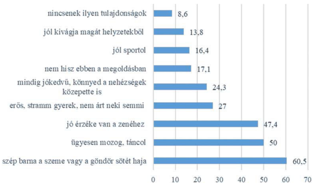
4. ÁBRA Melyek azok a sok esetben roma/cigánysághoz kapcsolt adottságok, készségek vagy fizikai jegyek, amelyeket Ön is megerősít/ene gyermekében a pozitív romakép kialakítása érdekében! (%)

vagy ügyesebben mozog majd, így végül a feltételezett genetikai tulajdonság helyett szerzett tulajdonság is lehet. A gyermek temperamentumával kapcsolatos pozitív megerősítések a szülők negyedénél meghatározó fontossággal bírnak. Vannak ugyanakkor olyanok is, akik ezzel a megoldással nem értenek egyet és ezért csak másképpen, vagy egyáltalán nem szeretnék a roma identitást átadni. Az egyik szülő felhívta a figyelmet az egyik legfontosabb különbségre, miszerint nem a pozitív romaképet, hanem a pozitív énképet kívánják gyermekükben megerősíteni. Van, aki megjegyezte, hogy a felsorolt válaszok sztereotípiák és nem cigánysága miatt jó ezekben a dolgokban a gyermek. Többen megjegyzik, hogy a gyermek tulajdonságait cigányságtól függetlenül pozitívan erősíti meg (4. ábra).