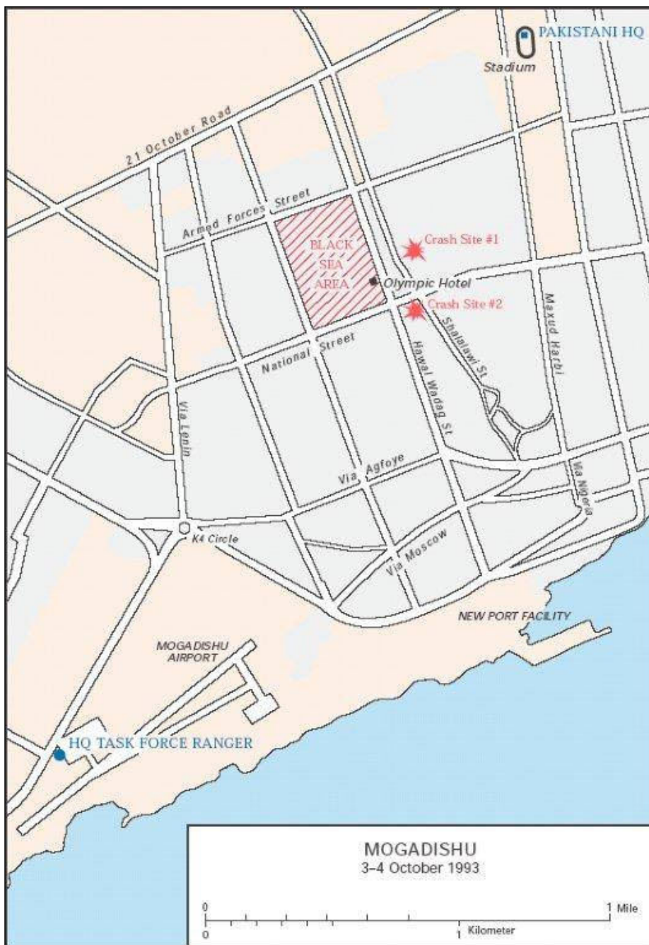
1. KÉP Mogadishu 1993. ( http://img.photobucket.com/albums/v231/HeavyArty/OP%20Gothic%20Serpent%20Black%20Hawk%20Down%201993/Battle_of_mogadishu_map_of_city_zps0227e848.jpg )