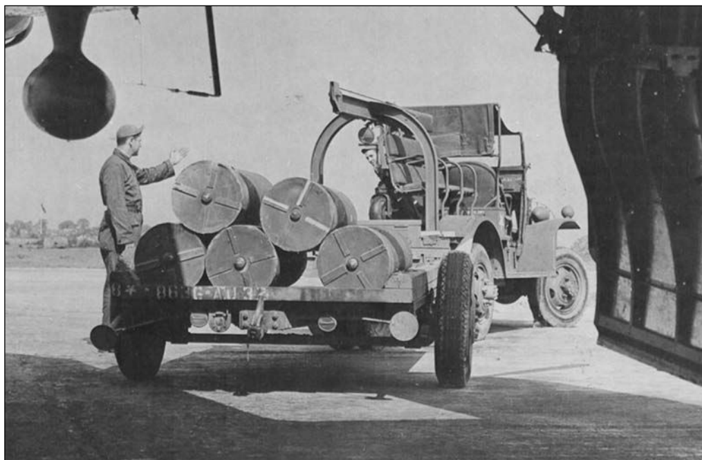
3–4. KÉP Egy 500 fontos röplapbomba szerelése és berakodása egy B-17 típusú bombázó repülőgéphez. A laminált papírból, az M-17 típusú gyújtóbomba mintájára készült eszközöket először James Monroe százados alkalmazta a 305. Bomb Groupnál, erre tekintettel nevezték ezeket „Monroe bombáknak”.