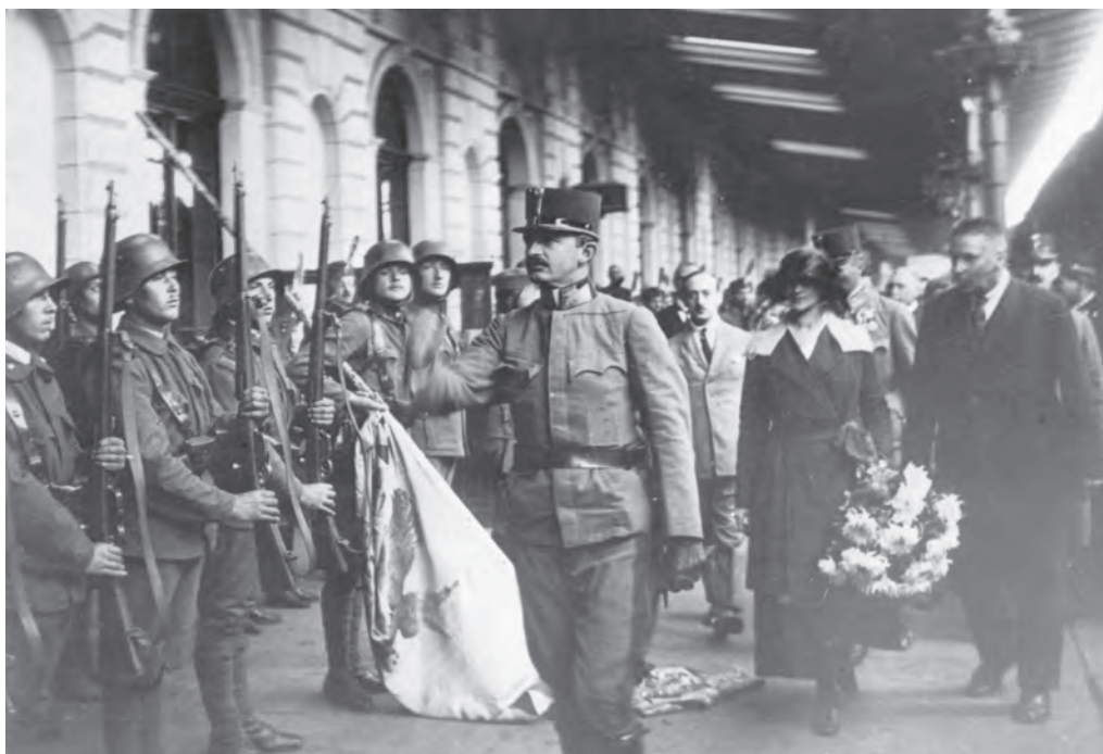
3. ÁBRA IV. Károly fogadja az érkezése alkalmából felsorakozott győri helyőrség tisztelgését az 1921. őszi második visszatérési kísérlete során

buzgó vallásosságát, és rajongásig szeretett házi tanítójától, Tormássy Artúrtól megtanulta a magyar nyelvet, megszerette a szépirodalmat. 1911-ben feleségül vette Zita bourbon–pármái hercegnőt, és rövid ideig tartó harmonikus családi életükben az első gyermek, Ottó születése után úgy következtek a kis örökösök, mint az orgonasípok. A Habsburgok jó génjei révén mind a nyolcan magas életkort értek meg.