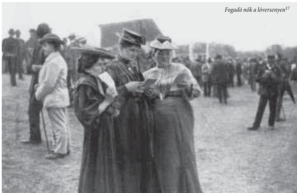
Fogadó nők a lóversenyen 17

számára történő kedvező értékesítése volt. Ezzel megvalósult a Széchenyi és Wesselényi által megfogalmazott mérvadó gondolatok egy része. (A második világháborút követően megszűnt létezni a 85 évet megélt szervezet, amely fontos szerepet játszott a lovasügy előremozdításában.) A megfontolt irányítás eredményeképpen az 1878-as és 1900-as párizsi világkiállításon a magyar lovak nagy sikert arattak, ami a külkereskedelemben anyagilag is változást hozott: a századfordulón 920 000-es lólétszám mellett 50-60 000 lovat értékesítettek évente külföldön. 18 Az 1878-as évben megjelent Veterinarius számai is kiemelten foglalkoztak a világkiállítás történéseivel, és nemzeti büszkeségről ad tanubizonyságot a következő részlet: „A párizsi lókiállítás mint ezt a kereskedelmi Miniszterium közli befejeztetett. Magyarország teljes sikert aratott. Minden államok közül egyedül Magyarországnak jutott a legnagyobb kitüntetés: nagy arany érem, melyet az állami ménesekről kiállított lovakért nyert el. A lótenyésztés emelésére alakult részvény társaság 29 drb. kiállított lováért, melyeket egy Francia nagy tenyésztő a kiállítás másod napján tenyésztési célból vett meg, ezüst érmet kapott. Kiállításunk fényes eredménye nagyban fogja előmozdítani a magyarországi lókitvel.” 19 A szaklapban egyébként is folyamatosan tudósítottak a legfrissebb lóversenyési fejleményekről, így például az 1879-es lókitvelti tilalomról 20 , lókiállításokról, 21 vagy éppen a turfon történt érdekes eseményekről.