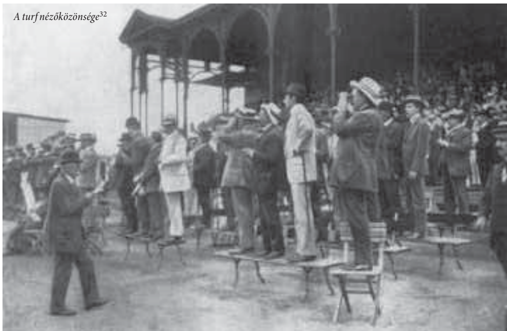
A turfnézőközönsége 32

a tagoltság. Vannak aktív szereplők, akik lovakat futtattak. A lótartáshoz hatalmas vagyon és erkölcsi feddhetetlenség kellett, ami a nemesség körére volt elsősorban jellemző. 31 A többi néző nem tekinthető teljesen passzívnak, hiszen a fogadások által részben „tevékeny” válhattak. Korábban már utaltam arra, hogy a társadalmi zárközöttség feloldódott a turf által, ami abban nyilvánult meg, hogy a különböző társadalmi helyzetű emberek ugyanazon az eseményen vettek részt. Az ellentétek ezzel egy időben mélyültek is, mivel egyrészt a lóversenyzés exkluzív sport (volt), azaz elegendő nagyságú tőke kellett a lovak fenntartásához és versenyztetéséhez, ugyanakkor az ezzel járó haszon (nyeremény, társadalmi elismertség) is csak őket érintette. Másrészt a különböző árú jegyek által egy olyan térszabályozás jött létre, ami elkülönítette egymástól az eltérő anyagi helyzetű embereket.