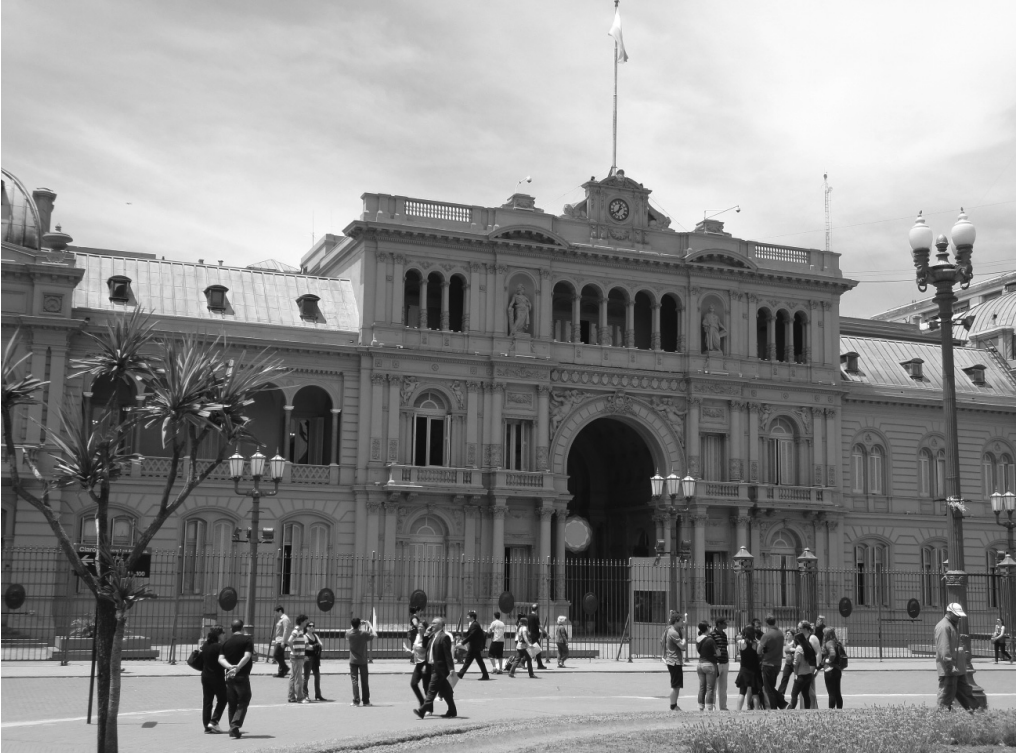
FOTO La Casa Rosada en Buenos Aires, Argentina ❖ La foto fue tomada por Emese Baranyi en 2011.