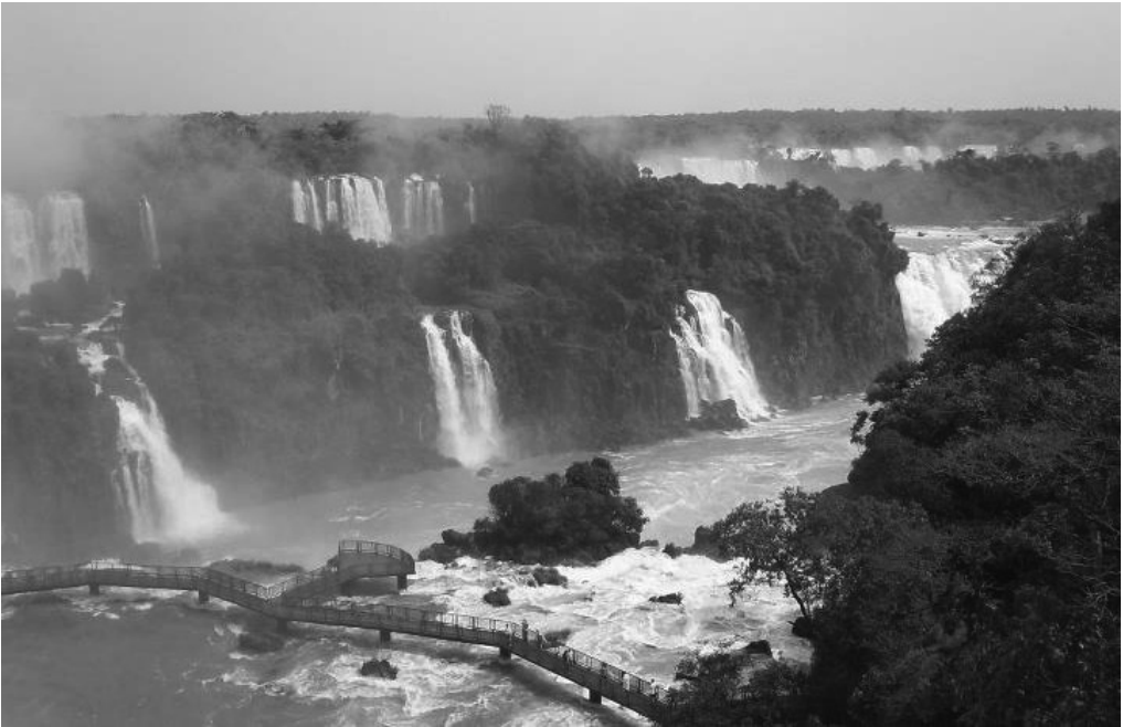
1. FOTO Cataratas del Iguazú

Durante el fracaso completo de La Asociación Latinoamericana de Libre Comercio (ALALC) la cual estuvo vigente entre 1960 y 1980 cuando fue reemplazada por los intentos de La Asociación Latinoamericana de Integración (ALADI), que aplicó métodos de integración diferentes al anterior, se establecieron iniciativas prometedoras en América Latina durante los años 1980. La visión espantosa del comunismo se debilitó a través del cambio radical de la política global (o sea, el alivio de la guerra fría), lo que contribuyó al reemplazo de los gobiernos militares de los dos países más grandes de la región – Argentina y Brasil – por nuevos gobiernos democráticos. Estos cambios posibilitaron poner en primer plano la cooperación en vez de las tensas relaciones exteriores que antes habían predominado su comunicación. 4