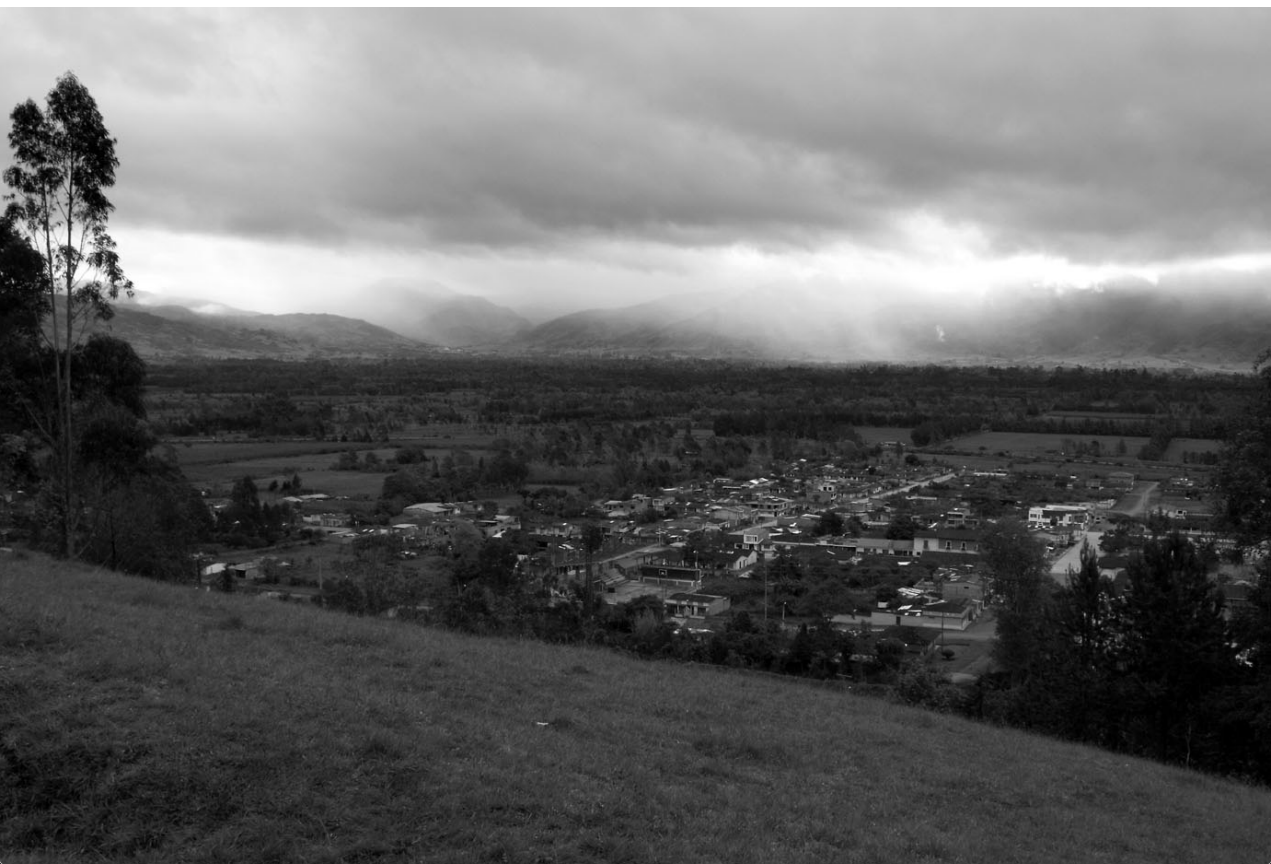
FOTO Valle de Sibundoy en el sur de Colombia, antiguo territorio de los indígenas camsa e inga