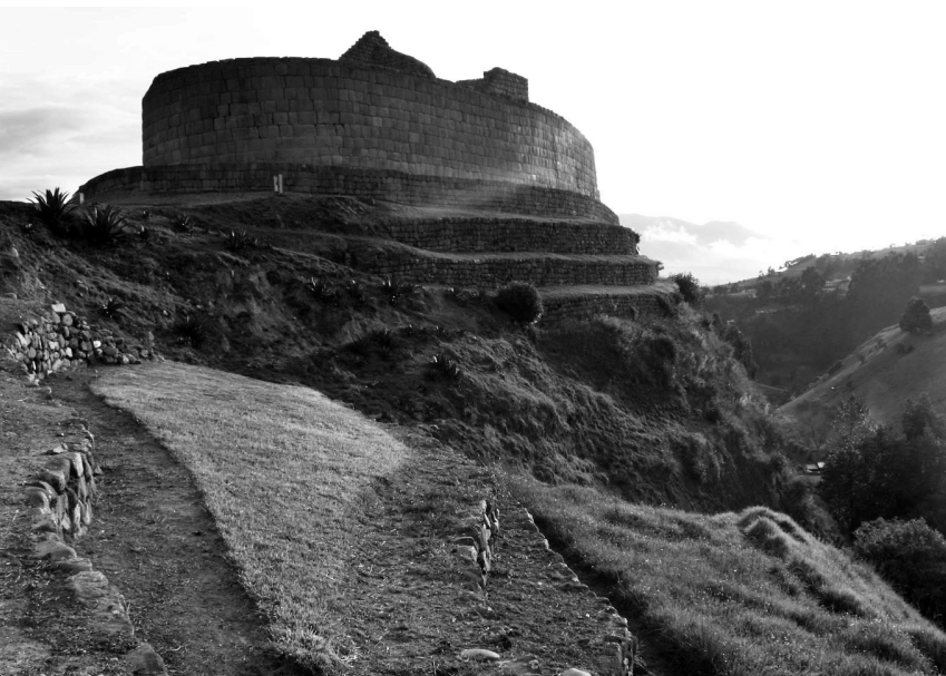
2. FOTO Las ruinas de Ingapirca en Ecuador ❖ La foto fue tomada por el autor del artículo en 2011.

más lento que en el Caribe. Así, hoy la población indígena de estos países todavía es mucho mayor que la de Colombia o de Venezuela. Una experiencia personal de 2011 en la región central de Ecuador sostiene esto, además me dió una foto instantánea de la situa-