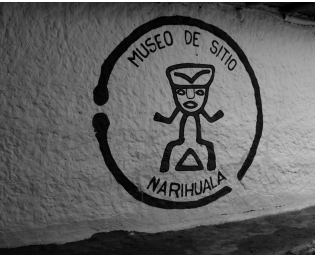
3 Foto Narihualá, Peru: la entrada de la ciudad de ruinas de los Tallanes, hoy día es museo

La historia precolonial de Perú es identificada principalmente con la historia de los Incas 13 aunque, antes de la ascensión de los Incas en el siglo 15., varias culturas indígenas importantes estaban prosperando en el territorio que hoy día abarca el país. 14 La cultura tallán (900 d. C. – 1500 d. C.) con el centro en Narihualá era significativa en el Norte de Perú (región Piura) incluso después de las conquistas de los Incas. La antigua ciudad en ruinas actualmente funciona como museo. Los descendientes de la cultura indígena antiguamente floreciente no tienen mucha posibilidad en la vecindad del desierto de Piura para participar con éxito en la competición económica del siglo 21. globalizado. Por un lado, esperan la prosperidad de la ganadería tradicional, por otro lado, del turismo.