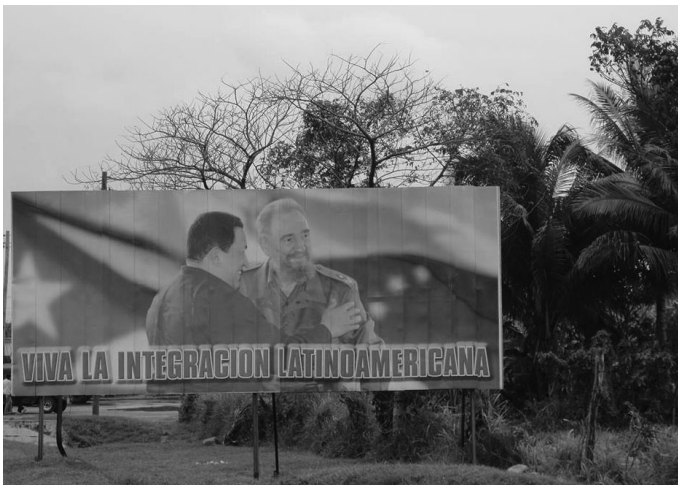
1 Foto ❖ Propaganda cubana de la integración Latinoamericana ❖ La foto fue tomada por Emese Baranyi en 2010.

En el caso de las integraciones regionales, y especialmente en cuanto a América Latina, las negociaciones deben ir más allá de la dimensión comercial, incorporando también la infraestructura, la energía, el medio ambiente, el desarrollo social sostenible y la cooperación financiera. Pero en el inicio de la década de 2000 el proceso de integración regional se desaceleró debido a la debilidad de las instituciones comunes, a los acuerdos comerciales bilaterales concluidos en paralelo a los procesos multilaterales y a los diferentes ambientes políticos nacionales (BAUMANN 2008).