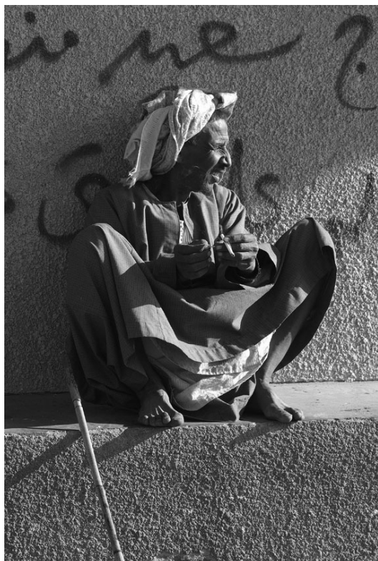
A tevehajcsár és a cigarettaszünet